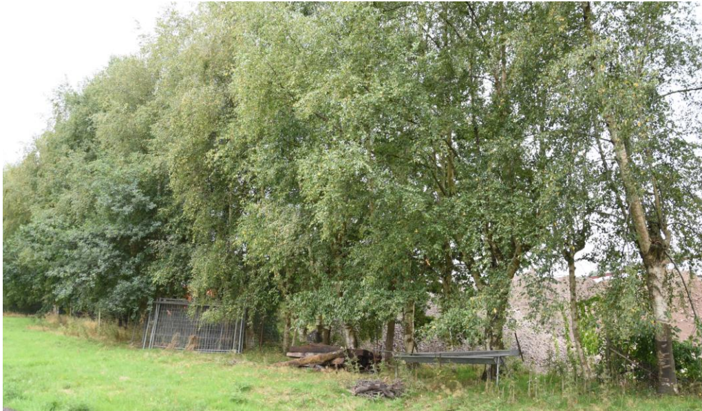
Abbildung 3: Gehölzbestand B