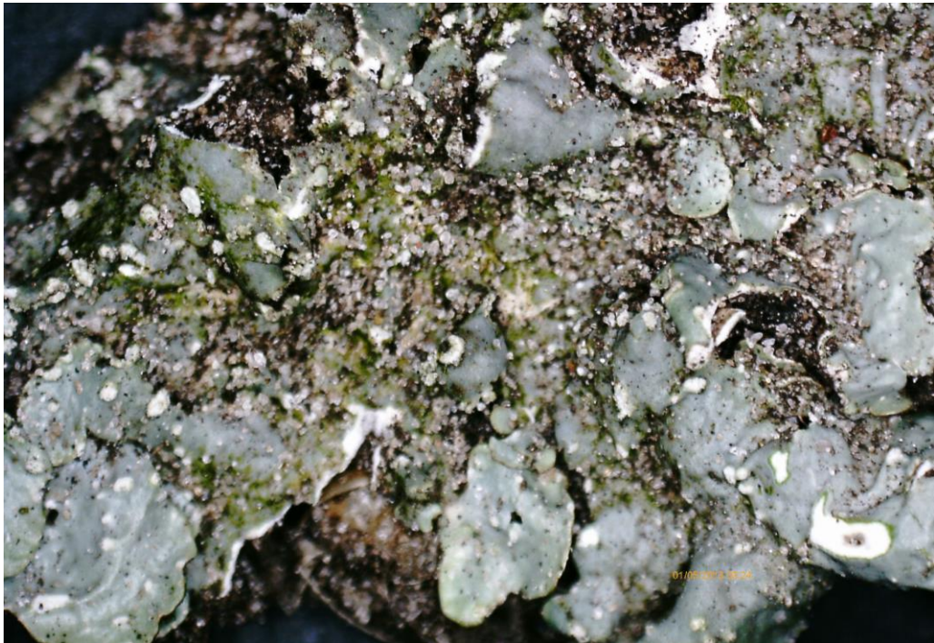
Abbildung 5: Mangel exemplar von Punctelia jeckeri auf abgebrochenem Wipfelzweig der Eiche Nr. 3

In regionaler Betrachtung fällt auf, dass nur zwei der Arten der früheren Sammelgattung Parmelia heute als häufig anzusehen sind. Parmelia sulcata und Melanelixia subaurifera wurden seit dem Jahr 1999 an ca. 36 bzw. 12 % der untersuchten Gehölze festgestellt 1 . Demgegenüber wurden die beiden anderen hier festgestellten Arten dieser Gruppe bedeutend seltener gefunden: Punctelia jeckeri - 1 %, Melanohalea exasperatula - 1,2 %.