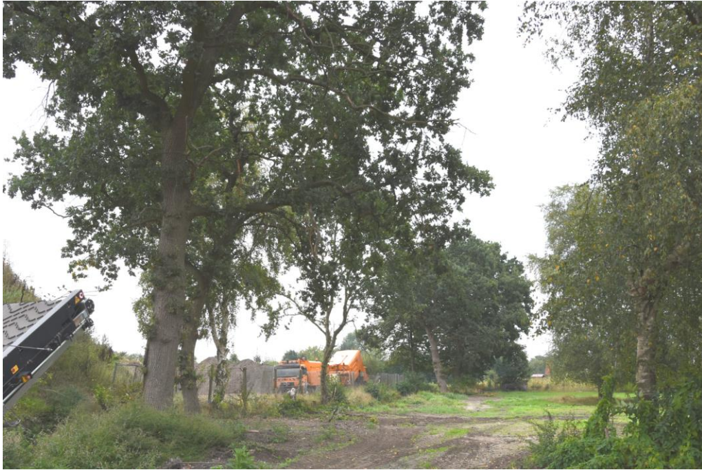
Abbildung 2: Gehölze 1 bis 5 entlang eines Grabens im geplanten Erweiterungsbereich