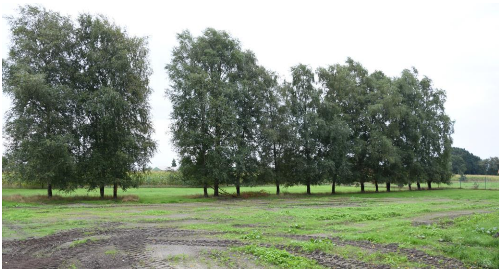
Gehölze im Erweiterungsbereich des Betriebsgeländes des Lohnunternehmens Johann Janssen (Aurich-Middels)